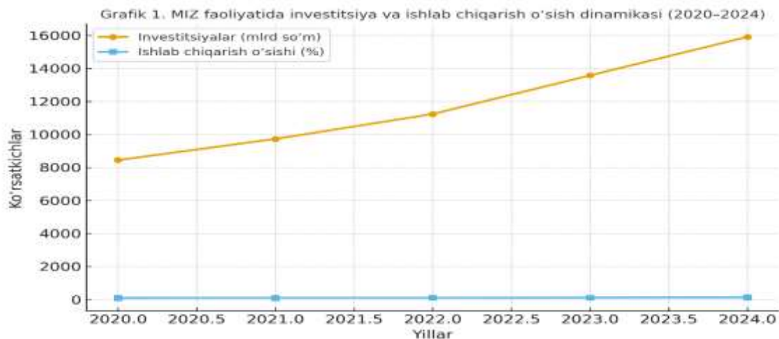
График 1. МИЗ фаолиятида инвестиция ва ишлаб чиқариш ўсиш динамикаси (2020–2024)

МИЗларда жорий этилган рақамли технологиялар даражаси 5 асосий мезон бўйича баҳоланди: электрон ҳужжат айланиши, солиқ бошқаруви, логистика мониторинги, маълумотлар таҳлили ва кадрлар рақамли компетенцияси.