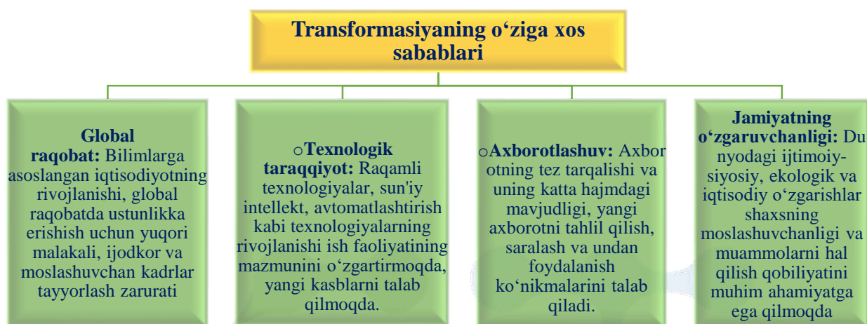
1-rasm. Transformasiyaning o'ziga xos sabablari