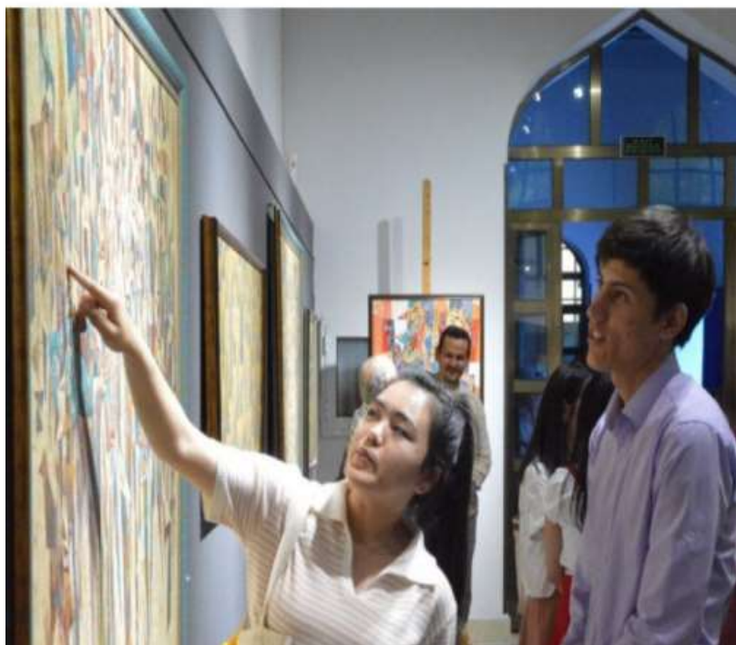
Рис .1 Обсуждение картины.