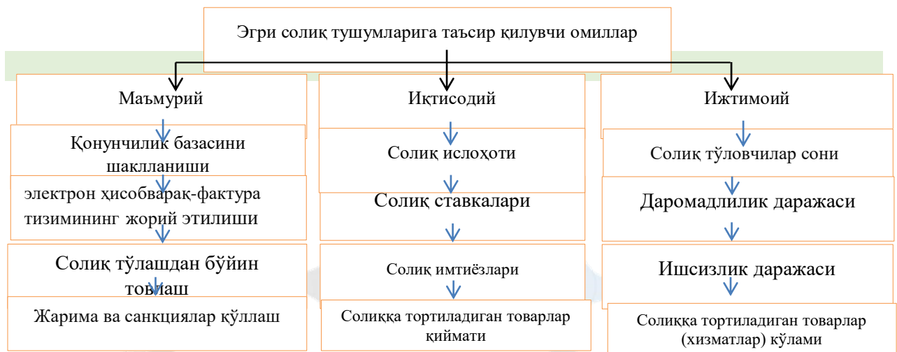
4-расм. Билвосита солиқлар бўйича бюджетга тушумлар даражасига таъсир этувчи омиллар

Юқоридаги 4-расмдан кўришимиз мумкинки, билвосита солиқ тушумларига бир қатор омиллар, жумладан маъмурий, иқтисодий ва ижтимоий омиллар таъсир кўрсатади. Билвосита солиқ тушумларига таъсир этувчи маъмурий омилларга асосан солиқ механизмнинг қонунчилик базасини шаклланиши, билвосита солиққа тортиш механизми ва солиқ маъмурчилигининг такомиллашганлигига боғлиқдир.